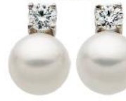
Weißgoldohrstecker mit je einer Südseezuchtperle und einem Brillanten (0,40 ct), von Friedrich.