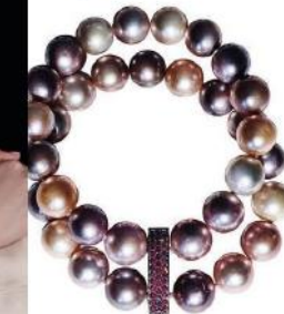
Perlenarmband mit Südseeperlen und 114 Brillanten, aus der Kollektion „Flora & Fauna“ von Sévigné, 7500 €.