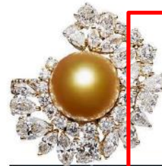
„Te & Dior“-Ring aus Gelbgold mit Diamanten und einer Zuchtperle, von Dior.