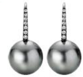
Ohringe aus rhodiniertem Weißgold mit 14 Brillanten (0,09 ct) und Tahiti-Zuchtperlen, von Yana Nesper, 1200 €.